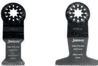
Lama Starlock - dentatura giapponese