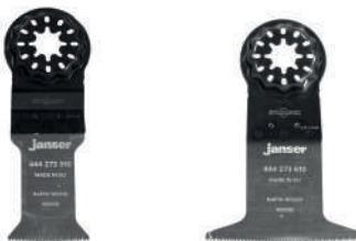
Lama Starlock - Rapid Wood