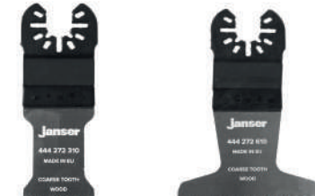
Lama per sega multiutensile - a dentatura grossa