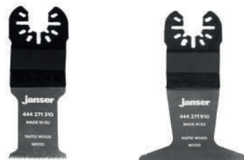
Lama per sega multiutensile - Rapid Wood