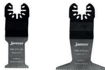
Lama per sega multiutensile - bi-metallo