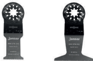
Lama Starlock - bi-metallo